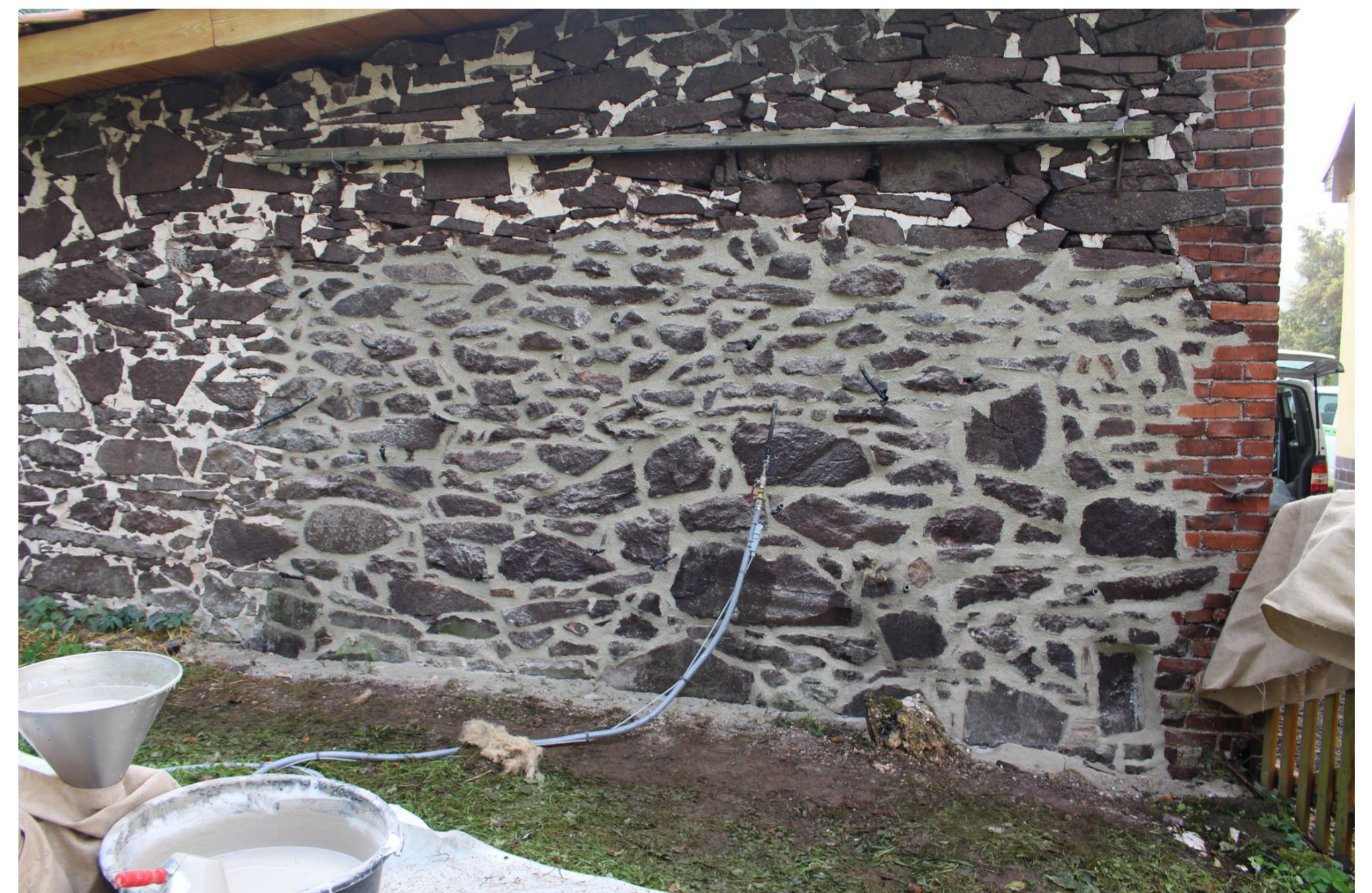
Bild 2: Sanierung gipshaltigen Mauerwerks mit Injektionsschaummörtel und Fugenmörtel auf der Basis des patentierten Bindemittels