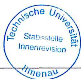
Dennys Klein Kanzler

Die Rücklagen i.H.v. 5.500,00 Euro die sich zum Ende des Jahres 2019 ergeben dienen vor allem der Sicherung des allgemeinen Büro- und Geschäftsbetriebes, den Gehaltszahlungen an den studentischen Konsul und der Deckung der im ersten Quartal 2020 anfallenden laufenden Kosten. Die Rücklagen aus dem Jahr 2019 bestehen neben den 5.000 EUR für die Veranstaltung ISWI, aus 4.170,10 EUR Betriebsmittelrücklagen für das Quartal 1 2019 und voraussichtlich 20.000 EUR freie Rücklagen.