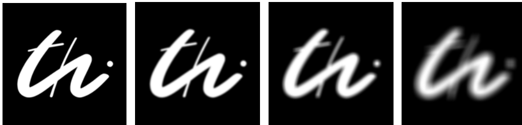
Abb. 2) Simulation der Unschärfe für unterschiedliche Defokussierungsabstände

anderen Weg. Hierbei wird in die Aperturöffnung der Optik eine Phasenplatte eingebracht, durch welche die durchlaufende Welle „kodiert“ und die optische Übertragungsfunktion verändert wird. Das daraus resultierende Bild erscheint zunächst unschärfer, erst durch eine digitale Nachbearbeitung des aufgenommenen Bildes wird die Phasenkodierung wieder herausgerechnet. Das Resultat ist ein Bild mit geringeren Aberrationen.