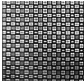
Abb. 2: Beispiel eines Phasengitters*

* J.-M. Fournier et. al., Proc. of SPIE 59300Y-1 (2005).