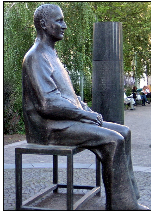
Abbildung 2: Bertolt Brecht-Statue vor dem Berliner Ensemble [Q2]

Auch das epische Theater hat als literarische Grundlage ein Drama, jedoch bedient es sich dem Stilmittel der Erzählung. Das epische Theater ist als Gegenentwurf zum dramatischen Theater entstanden, einer der ersten Vertreter ist beispielsweise Erwin Piscator, jedoch steht das „epische Theater“ vor allem für Bertholt Brecht. Seine Dramentheorie richtet sich nicht explizit gegen das griechische Drama, sondern sieht auf formaler Ebene eine Akzentverschiebung – weg von geschlossenen Handlungsmodellen hin zu offeneren Erzählungen. Weiterhin soll auf dieser Ebene Handlung vom Kommentar getrennt werden. Brecht fordert, dass nicht nur individuelle Schicksale dargestellt werden, sondern vielmehr die Zusammenhänge zwischen individuellen Lebensgeschichten und ihrem Zusammenhang mit gesellschaftlichen Entwicklungen. Die Gliederung des Stückes soll dabei möglichst heterogen sein, das heißt das Bühnenbild, die Handlungen der Charaktere, die eingesetzte Musik sollten möglichst kontrastreich zueinander sein.