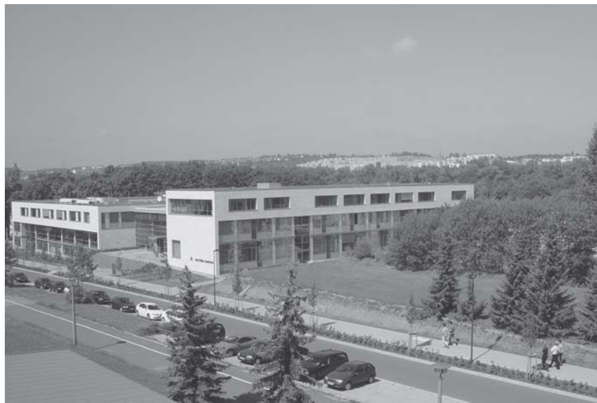
Auf dem freien Gelände neben dem Ernst-Abbe-Zentrum entsteht bis 2008 der Neubau für das Fraunhofer IDMT.