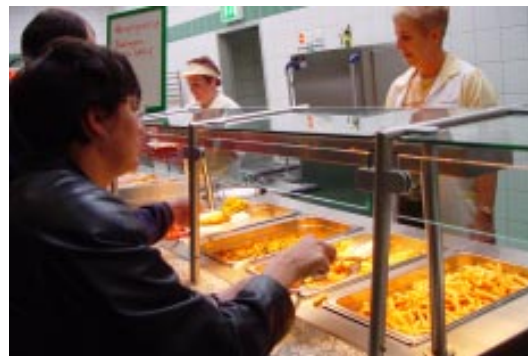
„Wählen Sie selbst!“ - lautet die Devise im neuen Wahllessenbereich. Unten: Mediterranes Ambiente in der PASTARIA.

ben dem Frühstück- und Imbissangebot werden von der Mittagszeit an bis 17.00 Uhr hier Pastagerichte, Salate, Desserts sowie Kaffeespezialitäten angeboten. ■ B.W.