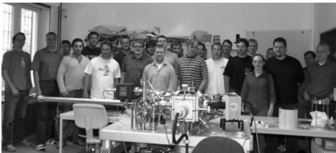
Erinnerungsfoto vom 1. Studentenworkshop in Clausthal. Der Gegenbesuch in Ilmenau ist für 2005 bereits fest geplant.

Die TU Ilmenau sei bestrebt, auch weiterhin Exzellenz in der Ausbildung zu gewährleisten. Die dafür erforderliche Ausstattung könne jedoch nicht über Studiengebühren finanziert werden, sondern erfordere eigene Konzepte der Universität. Studiengebühren würden dagegen die bereits vorhandene soziale Selektion weiter verstärken. So zeige eine HIS Studie, dass speziell in den ingenieurwissenschaftlichen Fächern der Anteil von Studierenden aus einkommensschwachen Familien relativ hoch ist. ■ B.W.