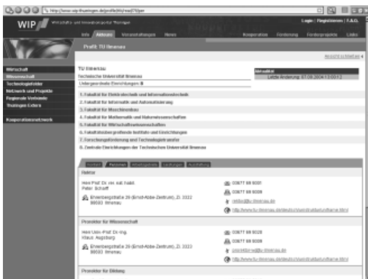
Die TU Ilmenau im Wirtschafts- und Innovationsportal Thüringen, zu finden unter: www.wip-thueringen.de