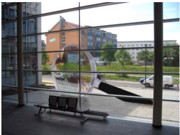
Fotomontage: Joachim B. Schulze

Nach dem Entwurf des Geraer Künstlers Joachim B. Schulze wird der Eingangsbereich des Ernst-Abbe-Zentrums mit einer Großlupe von einem Durchmesser von 2 - 2,5 Metern gestaltet. Die Lupe steht nach Aussage des Wettbewerbssiegers zum einen dafür, dass hier etwas „Großes“ entsteht. Zugleich ließ sich der Künstler von der Forschungsarbeit der im Abbe-Zentrum beheimateten Mikroelektronik und Nanomesstechnik inspirieren. „Hier werden kleinste Dinge sprichwörtlich unter die Lupe genommen“. Dass die „Optik“ nicht nur traditionell zum Begriff Abbe, sondern auch gut zum TU-Campus passt, zeigt unsere Bildmontage mit Blick aus dem Foyer des Ernst-Abbe-Zentrums. ■