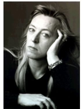
Die Nobelpreisträgerin Jody Williams.

Indem sich Studenten aus unterschiedlichsten Regionen der Erde kennenlernen und miteinander ins Gespräch kommen, leistet die ISWI einen Beitrag zur Förderung von Völkerverständigung und internationaler Gesinnung. Zugleich wollen die Organisatoren ein Zeichen gegen Fremdenhass und die wachsende Ausländerfeindlichkeit setzen. Im Frühjahr 2004 wurde dieses Engagement vom Thüringer Ministerium für Wissenschaft, Forschung und Kunst durch die Verleihung des mit 200 Euro dotierten Preises „Miteinander studieren in Thüringen“ gewürdigt. Das Organisationskomitee besteht aus rund 10 Studenten aus verschiedenen Studiengängen. ■