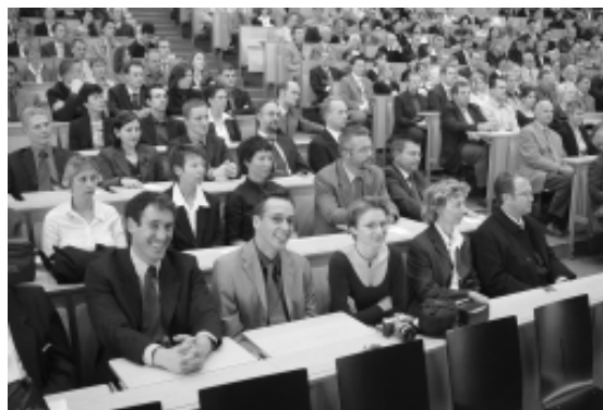
Ob Immatrikulation (links) oder Exmatrikulation - Anlass zur Freude gaben beide Anlässe offenbar gleichermaßen.