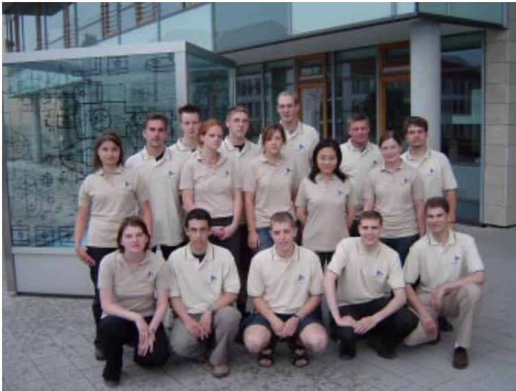
Studenten für Studenten: Das Organisationsteam der inova 2004.

Seit Bestehen der Messe haben sich von Jahr zu Jahr mehr Firmen beteiligt, die trotz konjunkturschwacher Zeiten ihre Kontakte zur TU Ilmenau intensiv pflegen und in die Nachwuchsförderung investieren. Denn: Qualifizierte Fachkräfte für ein Praktikum oder eine zu besetzende Stelle zu finden, ist eine der wichtigsten Grundlagen für langfristige Wettbewerbsfähigkeit. Der Erfolg der inova zeigt sich aber auch und vor allem am stetig gestiegenen und inzwischen enorm großen Interesse der Ilmenauer Studenten und Absolventen. ■ IUN