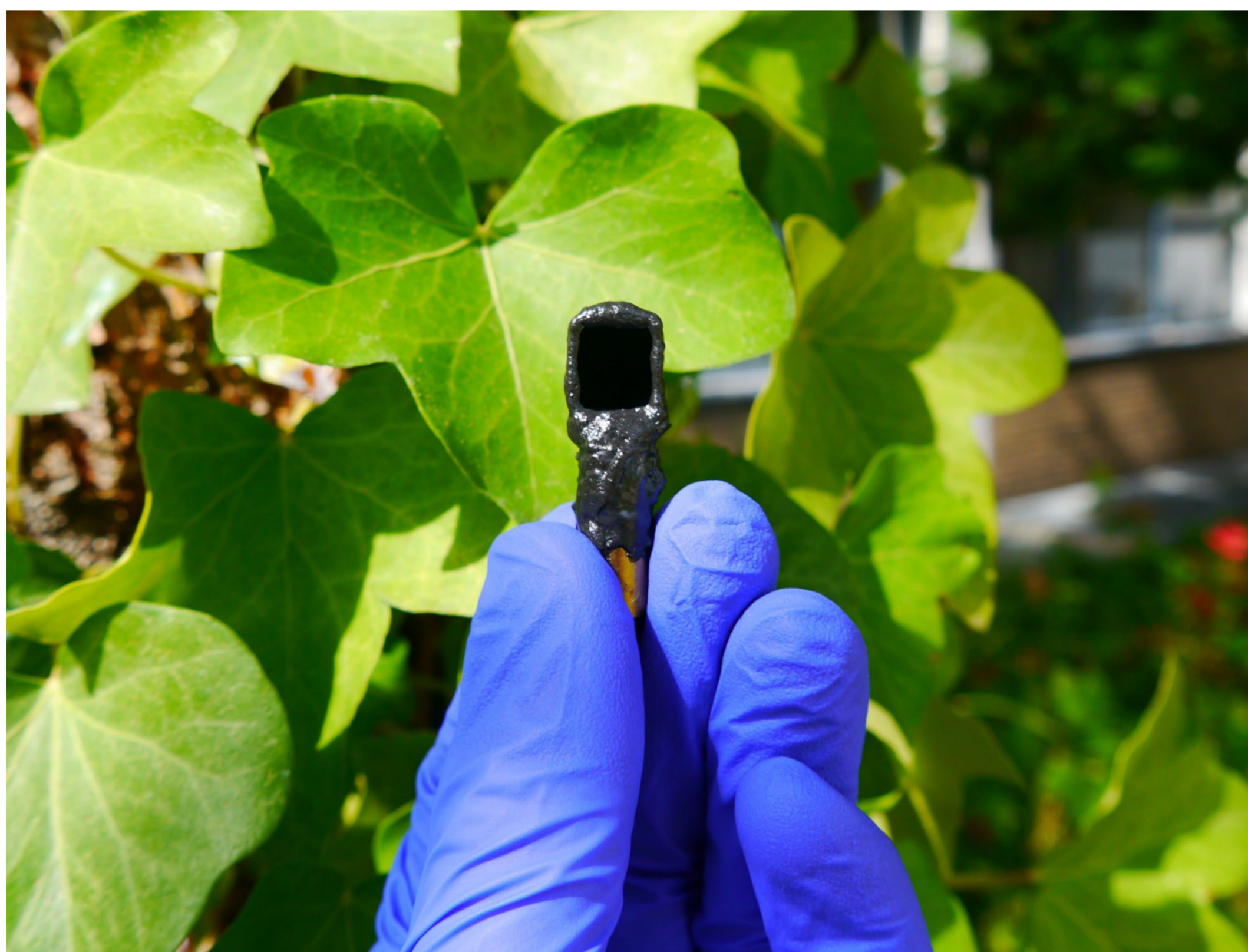
Bild 1: Die kleine Zelle wandelt rund 14 % der einfallenden Solarenergie in Wasserstoff um