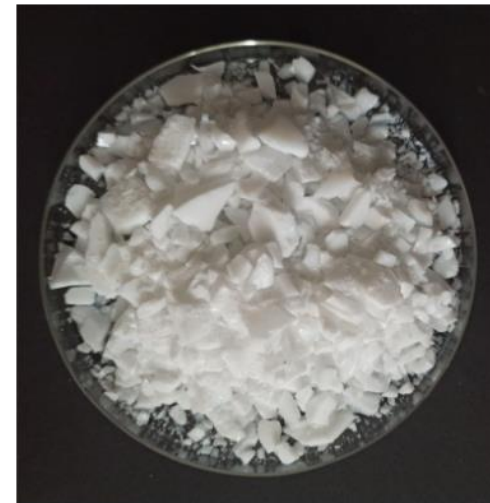
noch nicht rezyklierte Scherben