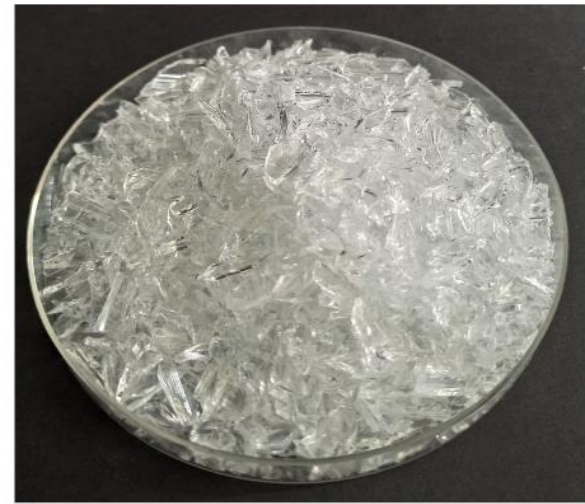
rezykliert für jede Anwendung