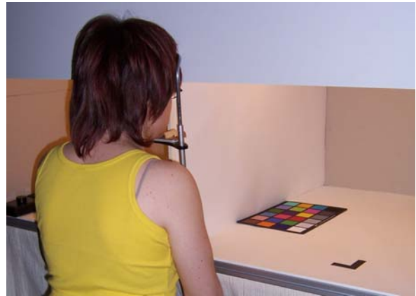
Abb. 3 Proband mit Kopfstütze vor Lichtsimulator

Da der CIE-Farbwiedergabeindex wie auch ein Großteil der anderen untersuchten Wiedergabeindizes auf dem Testfarbenverfahren beruht, werden als repräsentative zu bewertende Körperfarben ebenfalls die 8 CIE-Farben verwendet. Zusätzlich wird der MacBeth ColorChecker eingesetzt, um die Bewertung auf gesättigte Körperfarben auszuweiten.